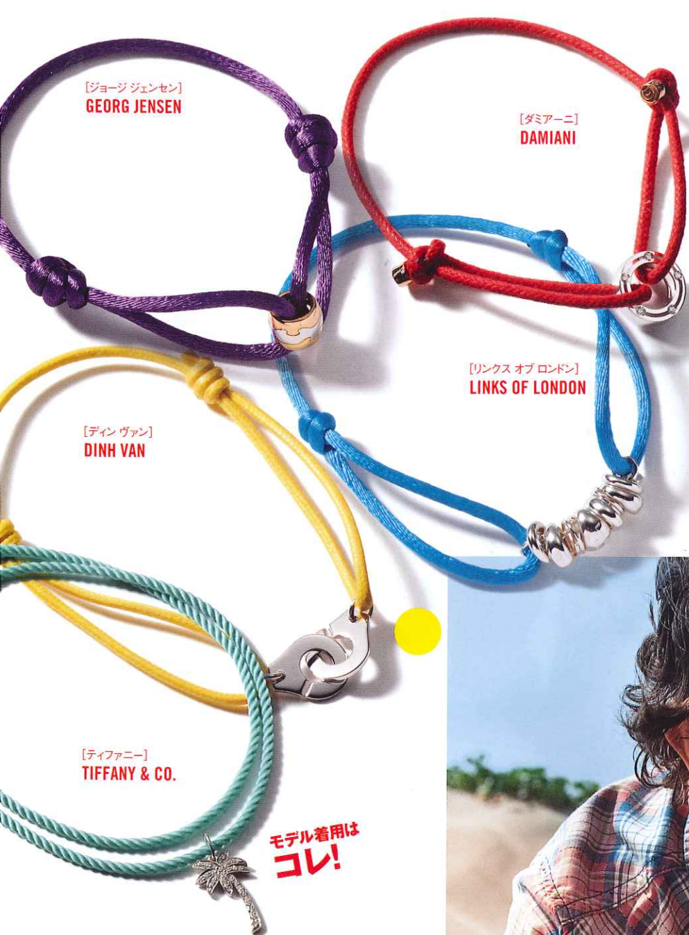
[ジョージ ジェンセン] GEORG JENSEN

気負わずカジュアルに取り入れられるアクセサリーの代表格といえば、カラーコードブレス。色が重くなりがちなこれからの季節の着こなしにカジュアルな爽快感を演出したいときはもちろん、チェックシャツなどのLA風スタイルにもマッチ。一点投入するだけでコーデインパクトに華やかな遊び心を加えてくれるアイテムだ。たとえばチェックシャツに使われている色を拾ってブレスをコーディネートするというのも、ワンランク上の着こなしに仕上げるひとつのテクニック。由緒あるジュエリーブランドからもコードブレスは多く出ているので、カラバリを揃えてその日の着こなしに合わせて使い分けるといったのも大人にはオススメだ。